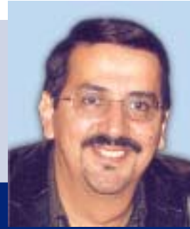
Lázaro Martínez NODO

E l juicio es una herramienta cualitativa que parte de los juegos de roles. Este ejercicio es de especial utilidad en estudios estratégicos que aborden el Brand Equity de las marcas, así como evaluaciones para detectar extensiones de línea o cambios de imagen, servicios, etcétera.